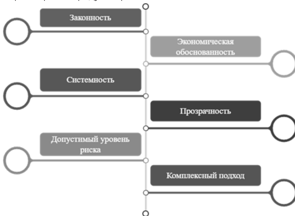
Рисунок 1. Основные принципы оптимизации налогообложения компании [9]. Figure 1. Basic principles of company tax optimization [9].

действия по оптимизации должны иметь под собой реальные хозяйственные основания, связанные с деятельностью организации (например, изменение структуры расходов, внедрение новых технологий, выбор выгодного режима налогообложения).